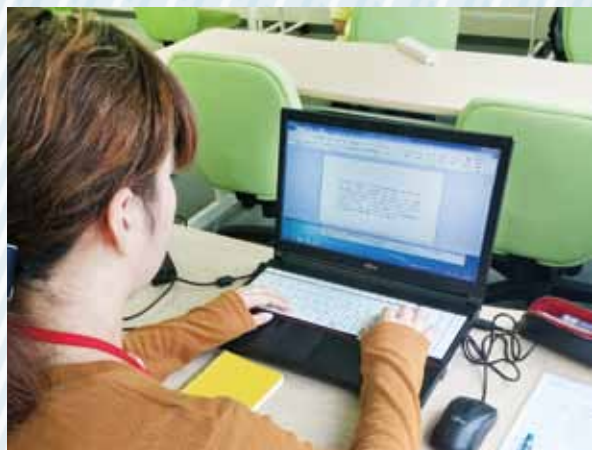
▲ワード・エクセルの基本・応用の操作スキル習得