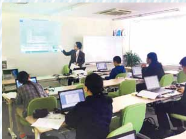
▲資格取得に向けた試験問題の解説と実践