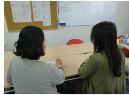
ウォーミングアップの様子

写真は社員が先輩役となり訓練生が先輩の誘いを断るといった場面を想定しての訓練の様子です。