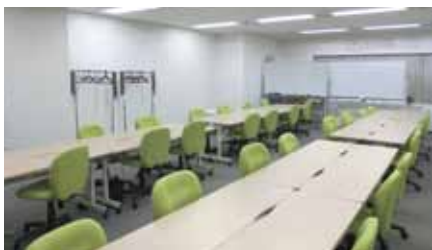
トレーニングルーム (イメージ)