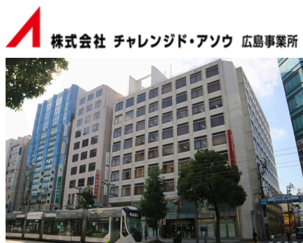
株式会社 チャレンジド・アソウ 広島事業所

〒730-0032 広島県広島市中区立町2-23 野村不動産広島ビル9階 市内電車「立町電停」徒歩1分 アストラムライン「県庁前駅」徒歩5分